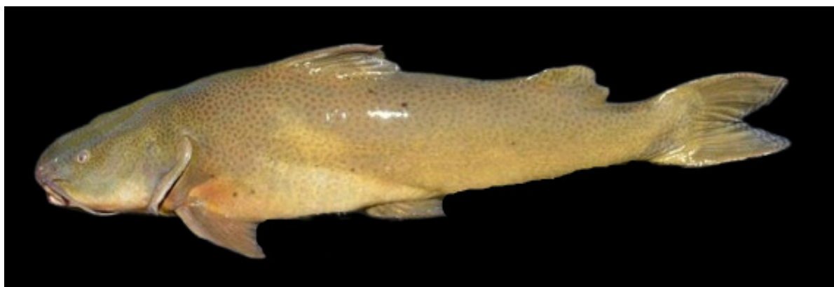
Figura 1. Zungaro jahu , 78,0 cm de comprimento total, indivíduo mantido vivo no CEPTA/ICMBio, Pirassununga-SP, Rio Moji-Guaçu, 21°55'41.6"S 47°22'28.6"W.

*Autor correspondente: arthur.vinicius12@uel.br