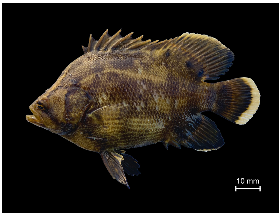
Figura 1. Lobotes surinamensis (Bloch, 1790) 92 mm CT, exemplar fotografado em vida e não catalogado, coletado no dia 16 de maio de 2024 na Lagoa de Araruama, região leste do estado do Rio de Janeiro, no município de Araruama, RJ, Brasil, 22°89'12" S, 42°38'65" W.

ORCID: https://orcid.org/0009-0009-6873-8208 (TMB); https://orcid.org/0009-0005-1216-4517 (LMF); https://orcid.org/0009-0006-9441-9110 (EJGP); https://orcid.org/0000-0002-6205-3517 (FDMC); https://orcid.org/0000-0002-0737-1184 (MRC).