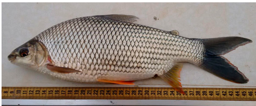
Figura 1. Exemplar de Prochilodus costatus capturado no rio São Francisco, na cidade de Pompéu (MG), exemplar não catalogado, 315 mm de comprimento padrão.

*Autor correspondente: alexandre.peressin@gmail.com