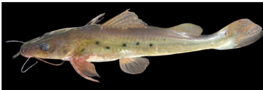
Figura 1. Hemisorubim platyrhynchos , 45,0 cm de comprimento total, indivíduo mantido vivo no CEPTA/ICMBio, Pirassununga-SP, Rio Moji-Guaçu, 21°55'41.6"S 47°22'28.6"W.

*Autor correspondente: lucas.henriqueebio@uel.br