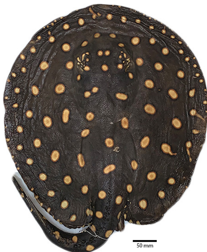
Figura 1. Potamotrygon henlei , MZUSP 104435, macho, 432 mm de largura de disco, Rio Araguaia, Tocantins (-9.26972, -49.97167).

*Autor correspondente: azevedojulia.p@gmail.com