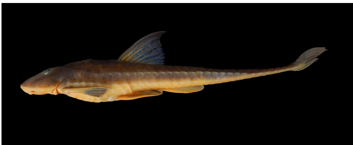
Figura 1. Loricariichthys castaneus , MZUFV 13586, 320 mm de comprimento padrão, Rio Doce, à montante da Usina Hidrelétrica de Mascarenhas, Baixo Guandu, Espírito Santo.

*Autor correspondente: gustavo.r.fernandes@ufv.br